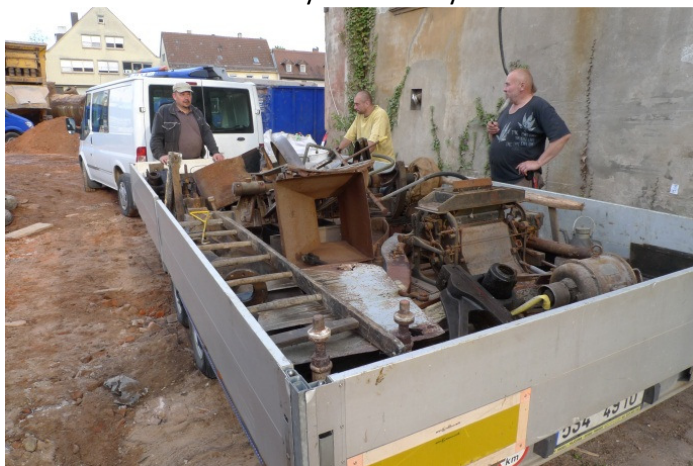
Rozebráno a hurá do Kostelce.