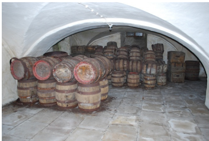
Sklady transportních obalů. Na vlastní oči jsme viděli, jak těžká mechanika bourá klenby a zasypává tyto prostory včetně sudů.