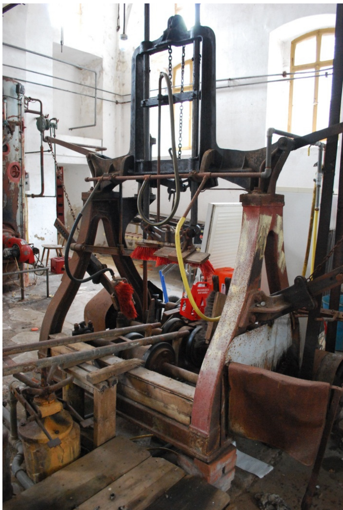
Zachráněná myčka dřevěných sudů.