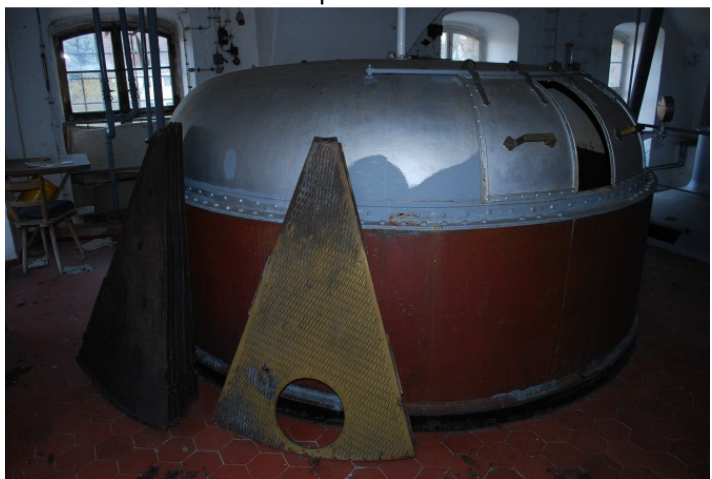
Scezovačka včetně plechů. U nás už by všechny barevné kovy byly samozřejmě ukradeny.