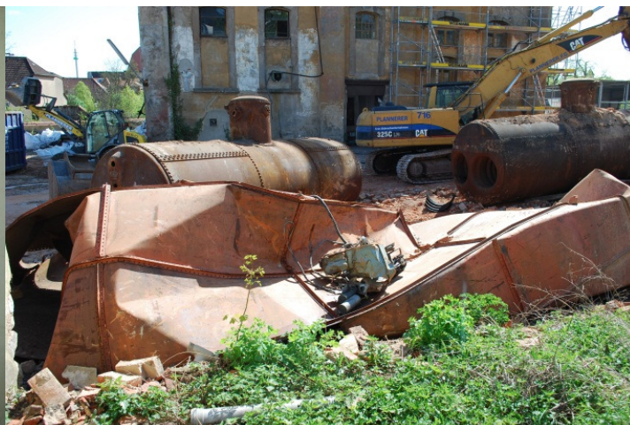
Zmuchlané chladicí štoky.

Jestli jste dočetli až sem, tak vězte, že si dnes v místech bývalého pivovaru můžete v tuctové eurokrabici koupit europivo a eurorohlík.