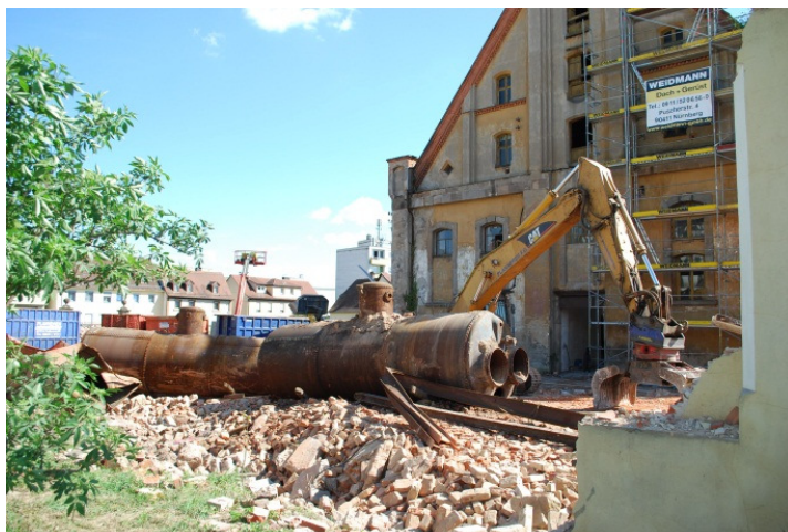
To nejsou ponorky, ale parní kotle.