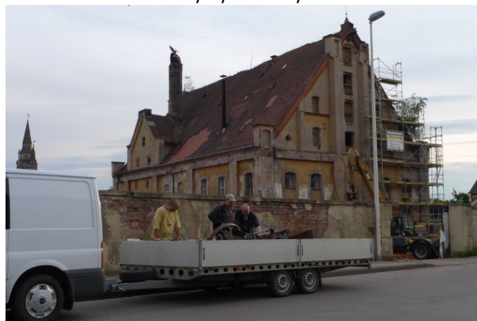
Poslední pohled na starý pivovar, novější část pivovaru se štokama stála v popředí.