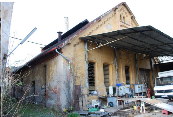
Novější část pivovaru s parní kotelnou, chladicími štoky a spilkou pod budovou.